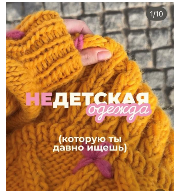
Пример обложки поста